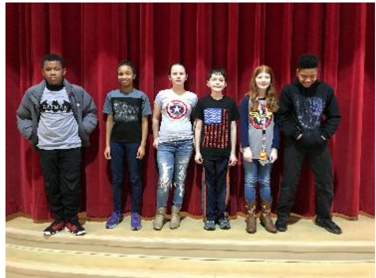
5 to Grado