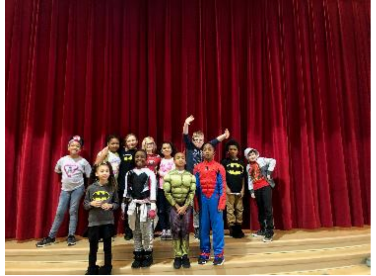
3 er Grado