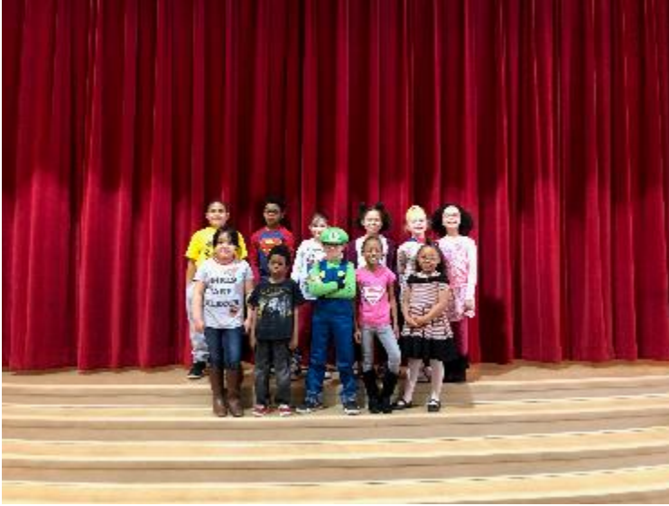
2 do Grado