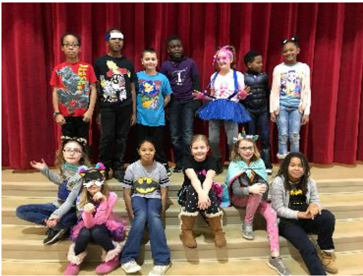
4 to Grado